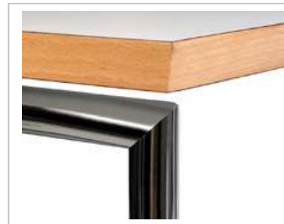
Klappbares Gestell auf Gehring