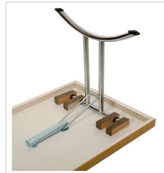
Klapptisch Funktion Doppel-T-Fuß-Gestelle