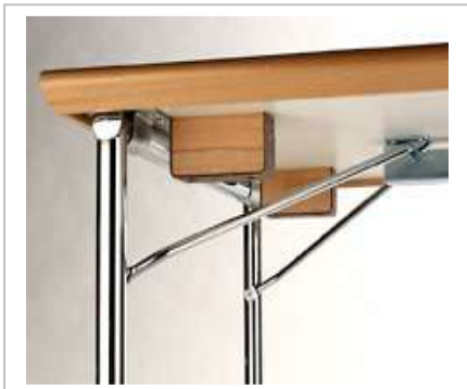
Klapptisch Funktion Vier-Fuß-Gestelle