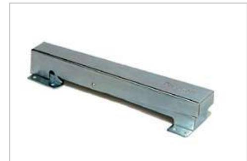
Klappbeschlag Metall rundum geschlossen